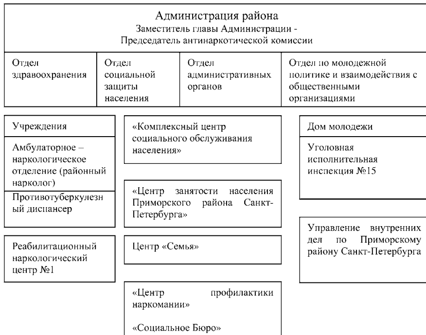
Рисунок 3. Схема партнерской сети по медико-социальному сопровождению наркозависимых и ВИЧ-инфицированных на районном уровне (по месту жительства).

комплексного межведомственного медико-социального сопровождения больных наркоманией и ВИЧ-инфекцией.